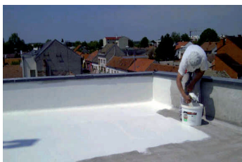
3. 1e laag KÖSTER 21