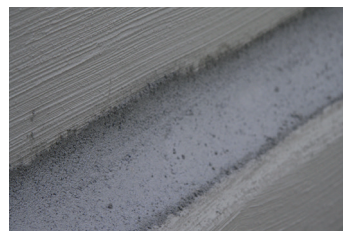
2. Holle plint met KÖSTER Reparatiemortel