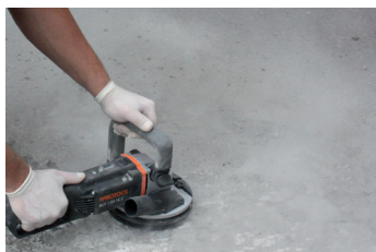
1. Ondergrond voorbereiding