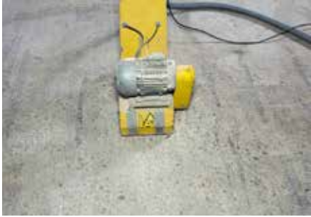
1 Ondergrond voorbereiding (hier frezen)