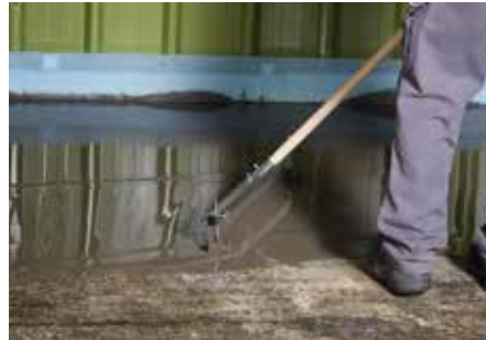
5 Verspreid over grotere oppervlakken met een in hoogte verstelbare trekker