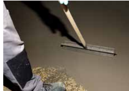
6 Ontlucht tot slot het materiaal met een prikrol