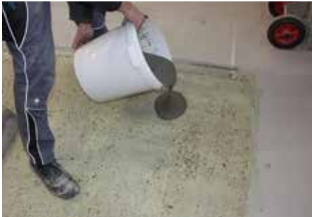
4 Verdeel direct na het mengen in de gewenste laagdikte