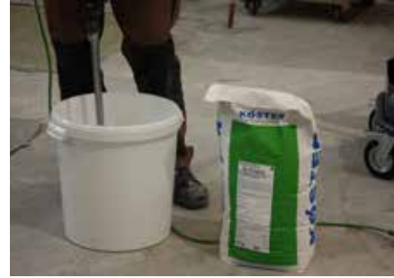
3 Minimaal drie minuten intensief mengen met een geschikte mixer